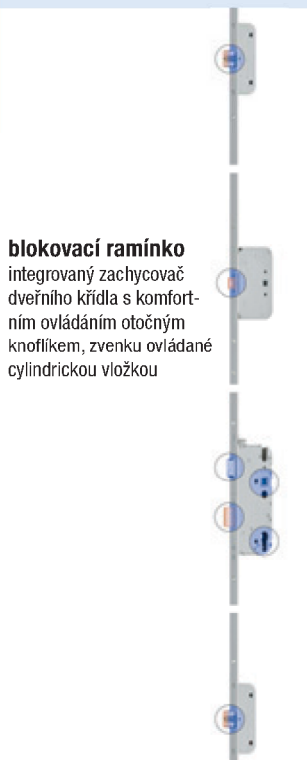
G.U-SECURY Automatic se špehýrkou

Napětí: 12 V Proud: 1 A umožňuje motorické otevření dveří